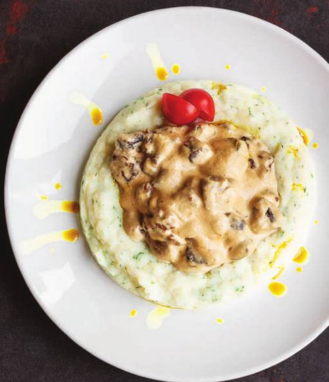
ТЕЛЯТИНА С ГРИБАМИ 120,000 СУМ