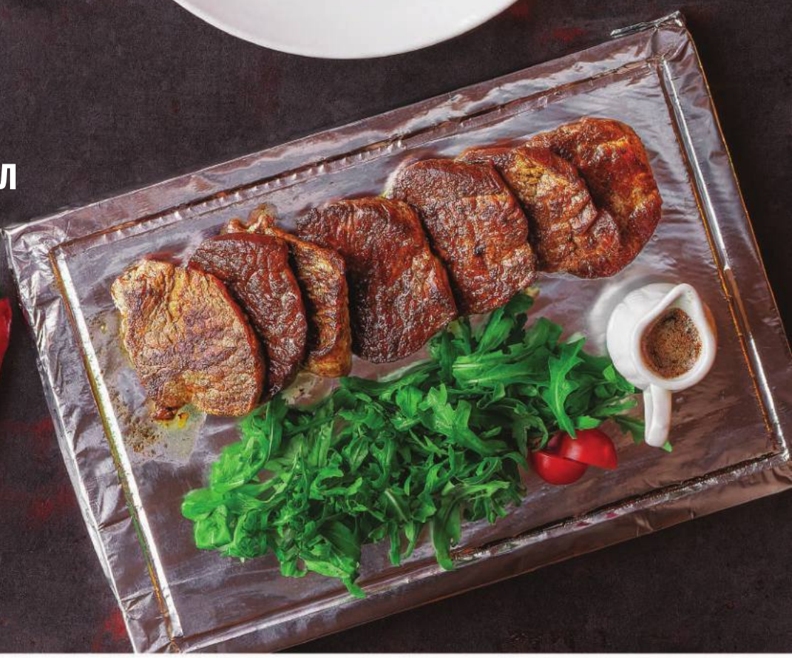
ПАНОРАМИК СПЕШЛ 340,000 СУМ