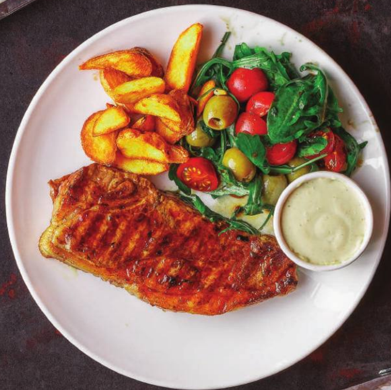
РИБАЙ СТЕЙК 210,000 СУМ