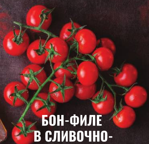
БОН-ФИЛЕ В СЛИВОЧНО- ГРИБНОМ СОУСЕ 340,000 СУМ