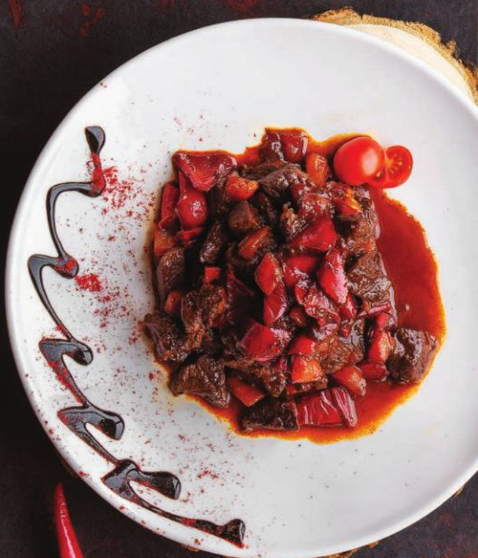
МЯСО ПО-КИТАЙСКИ 110,000 СУМ