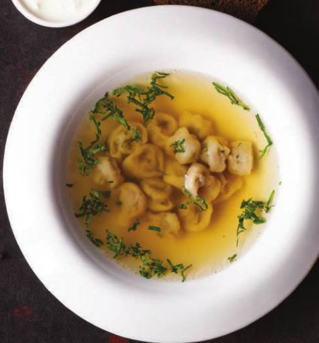
ПЕЛЬМЕНИ 35,000 СУМ