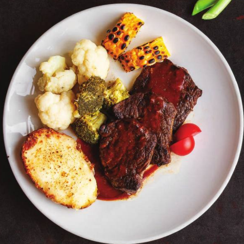
БОН-ФИЛЕ С СОУСОМ БАРБЕКЮ 140,000 СУМ