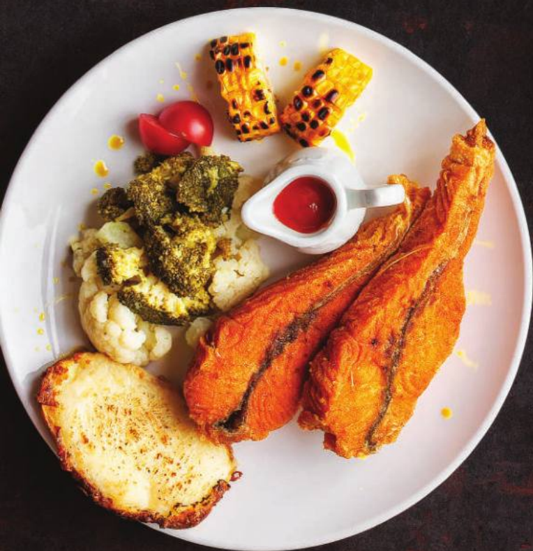
ЖАРЕНАЯ ФОРЕЛЬ 150,000 СУМ