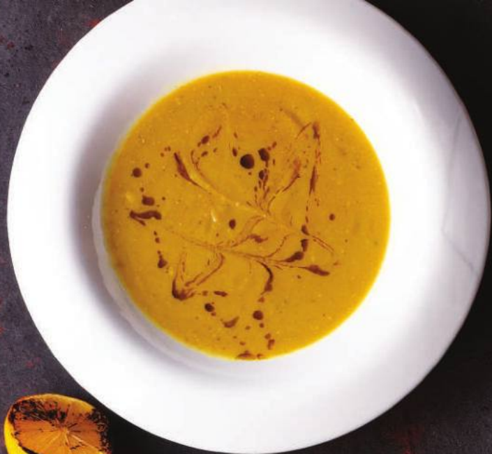
ЧЕЧЕВИЧНЫЙ СУП 35,000 СУМ